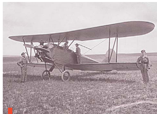
Легендарный самолет У-2 для первоначального обучения

Общество содействия обороне и авиационно-химическому строительству СССР было создано в январе 1927 года путем объединения двух крупнейших общественных организаций: общества содействия обороне СССР и Авиахима («дружья авиации, химической обороны и химической промышленности»).