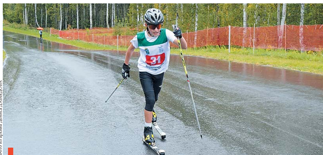
Тренировка на лыжероллерах в парке «Семейный» воспитанников секции лыжных гонок

– Секция бокса, самая молодая и перспективная, открылась в 2011 году. У нас занимаются 47 ребят. Принимаем с 7 лет, но перчатки юным боксерам надевать разрешено не ранее чем с 10-ти. С 12-ти они уже могут участвовать в соревнованиях.