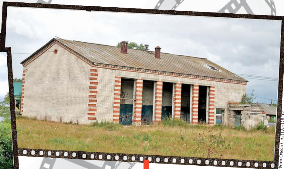
Клуб в деревне Заимке