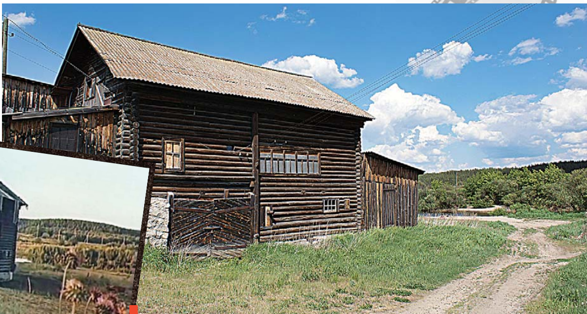
Место филатовских съемок за четверть века практически не изменилось. Разве что берег зарос ивняком. По-прежнему стоит деревянная мельница, все также громко заливаются лягушки и загорает на прибрежном песке местная ребятня.

История о том, как снимали кино в Филатовском, превратилась уже в легенду среди местных жителей. А вот достоянием прессы она становится впервые.